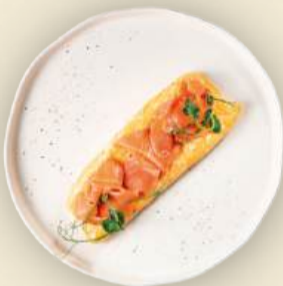
Омлет 180 г (с лососем) 820₽