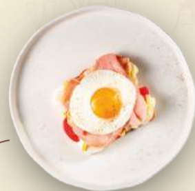
Тост с прошутто и глазуньей 200 г (глазунья, хлеб тостовый, прошутто котто, лист салата, помидор, сырный соус) 800₽