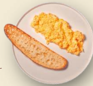
Скрембл с чиабаттой 235 г 450₽