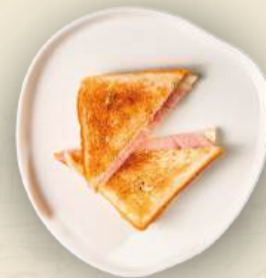
Сэндвич с ветчиной и моцареллой 130 г 390₽