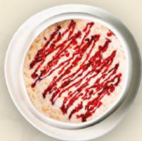
Каша овсяная с соусом вишня (на молоке или воде) 300₽ 260 г