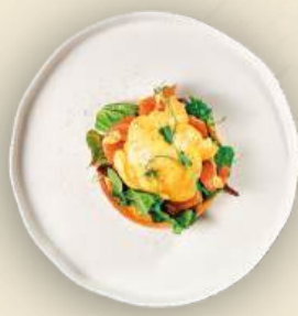
Яйцо бенедикт 170 г (с лососем) 850₽