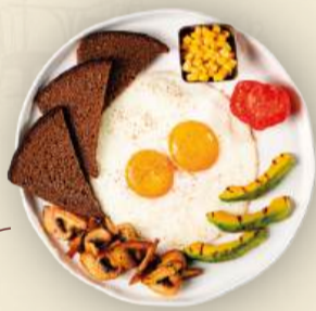
Фитнес завтрак 320 г (глазунья, авокадо, шампиньоны, помидор, кукуруза, бородинский хлеб) 850₽