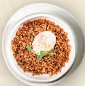
Каша гречневая с яйцом пашот 220 г 400₽