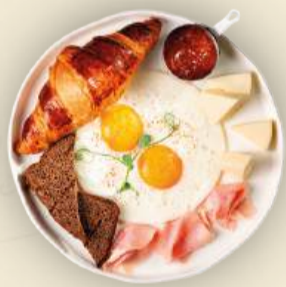
Итальянский завтрак 310 г (глазунья, круассан, джем, моцарелла, ветчина, бородинский хлеб) 950₽