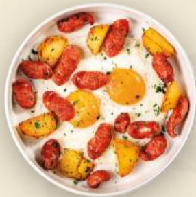
Глазунья с говяжьими колбасками и картофелем 220 г 720₽