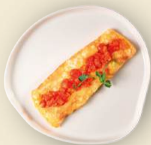
Омлет 180 г (с томатами и моцареллой) 450₽