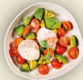
Авокадо, черри и яйцо пашот 300 г 890₽