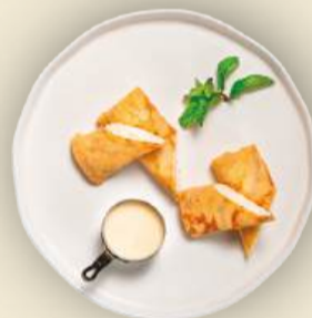
Блины с творогом и сгущенкой 250 г 490₽