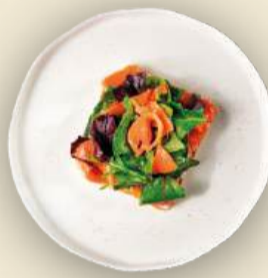
Тост с лососем и творожным сыром 145 г 870₽