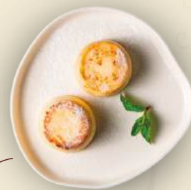
Сырники 170 г 490₽