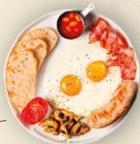
Европейский завтрак 350 г (глазунья, итальянская куриная колбаса, шампиньоны, бекон, фасоль в томатном соусе, помидор, чиабатта) 950₽