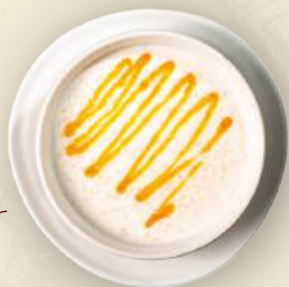
Каша рисовая с соусом манго (на молоке или воде) 350₽ 260 г