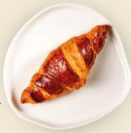
Круассан классический 60 г 190₽