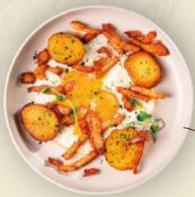
Глазунья с беконом и картофелем 650₽ 290 г