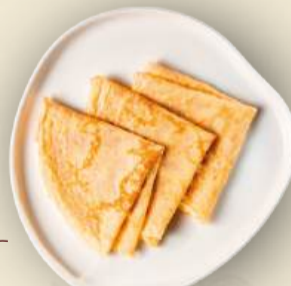
Блины классические 130 г 200₽