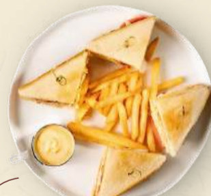
Клуб-сэндвич с картофелем фри и сырным соусом 520 г 1100₽